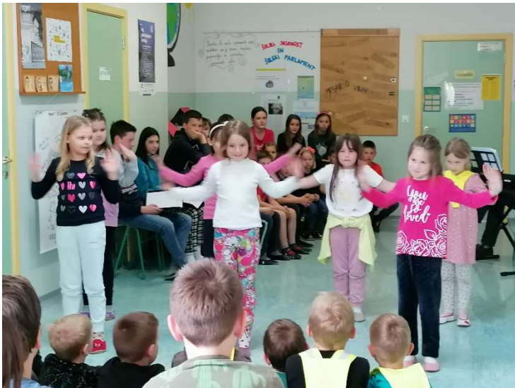
... plesali ...