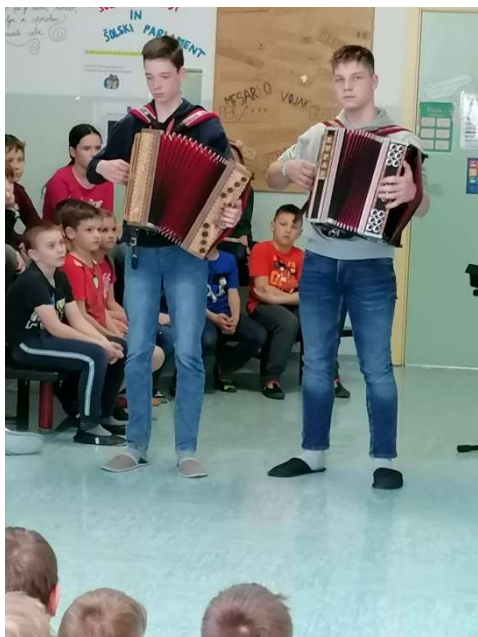
... in igrali na različne instrumente ob petju.